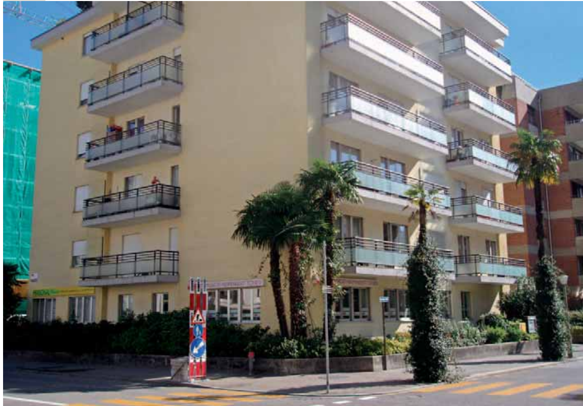
Nuova sede SIT in Via della Pace 3