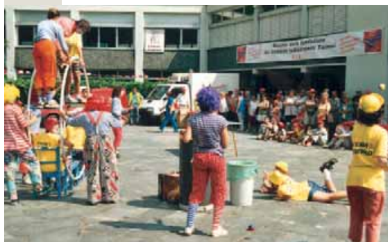
40° SIT: "Team benefico" pagliacci in azione, Cevio agosto 2001